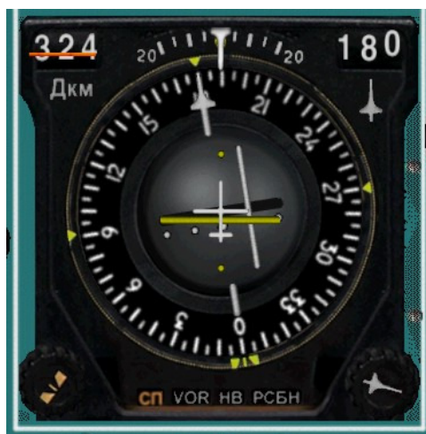
Рис.3. ПНП: Левее курса, ниже глиссады.

Индикация в кабине выводится на навигационный прибор – ПНП, НПП, ПСП или другой, какой установлен на самолете. Представляет из себя 2 «планки положения»: курсовую и глиссадную. Глядя на них пилот определяет положение самолета по курсу и по глиссаде, и, учитывая текущие параметры полета (курс, высоту, крен, скорость), рассчитывает и делает соответствующие поправки в курс и вертикальную скорость. А если курсовая и глиссадная планки положения находятся в центре прибора, это значит что и самолет находится на заданных линиях курса и глиссады.