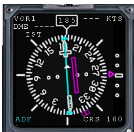
Рис.4. HSI: Левее курса, на глиссаде.

Индикация в кабине выводится на навигационный прибор – ПНП, НПП, ПСП или другой, какой установлен на самолете. Представляет из себя 2 «планки положения»: курсовую и глиссадную. Глядя на них пилот определяет положение самолета по курсу и по глиссаде, и, учитывая текущие параметры полета (курс, высоту, крен, скорость), рассчитывает и делает соответствующие поправки в курс и вертикальную скорость. А если курсовая и глиссадная планки положения находятся в центре прибора, это значит что и самолет находится на заданных линиях курса и глиссады.