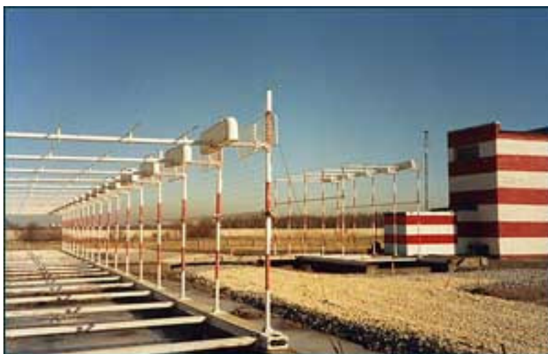
рис.1 Антенная система КРМ

Для выполнения захода по КГС в режиме ПСП на земле должна быть установлена собственно КГС. КГС состоит из Курсового Радио Маяка – КРМ, Глиссадного Радио Маяка – ГРМ и маркерных радиомаяков.