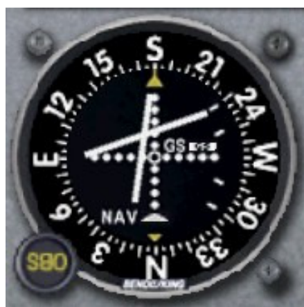
Рис.5. Правее курса, ниже глиссады.